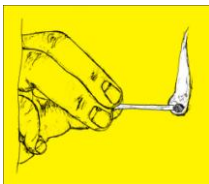
spelen met vuur

Inholland bekent kleur-verschil. De student bij Inholland wordt opgeleid tot een professional die in verschillende contexten verschillende stemmen van zichzelf laat klinken. Dat kan niet zonder dat hij geleerd heeft het eigen leven te onderzoeken. Dat lijkt op spelen met vuur. Gevaarlijk, riskant en tegelijkertijd verwarmend en in vuur en vlam zettend